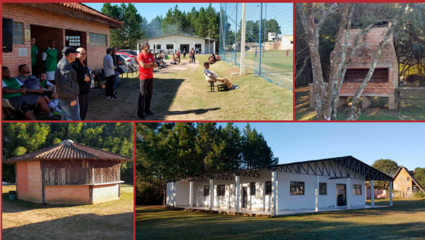
LEGENDA DA FOTO

Este sonho começou na Gestão 2002-2004 e, em 2005, foi concretizada a compra do terreno, com uma área de 14.000m 2 , na Estrada Chapéu do Sol, nº 1988. Em 2007, foi feito o cercamento do terreno e iniciada a construção das primeiras churrasqueiras, quiosque e sanitários, sendo a festa de inauguração desta primeira etapa realizada em 27/09/2008.